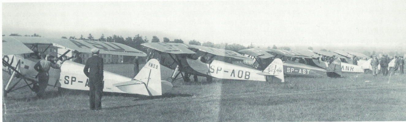
Samoloty RWD-8 biorące udział w VII Locie Południowo-Zachodniej Polski im. Franciszka Żwirki w 1936