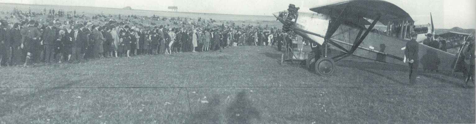
Obserwatorzy I Lotu Południowo-Zachodniej Polski. Na zdjęciu widoczny samolot Lublin R-X