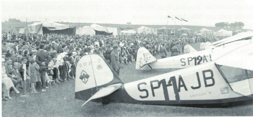
VI Lot Południowo-Zachodniej Polski im. Franciszka Żwirki w 1934. Na zdjęciu widoczne samoloty RWD-5 i PZL-5