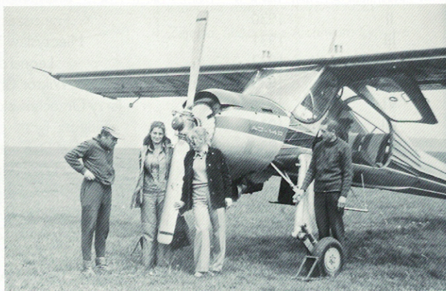
Powitanie uczestników XV Lotu Południowo-Zachodniej Polski przy samolocie Jak-18, 1964